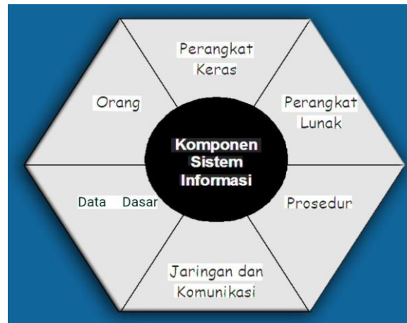
Gambar 1. Komponen Dasar Sistem Informasi Manajemen

Sistem Informasi Manajemen (SIM) merupakan sistem yang mengintegrasikan teknologi informasi dengan proses bisnis untuk memberikan informasi yang dibutuhkan oleh manajemen pada berbagai tingkatan (Sinergi Teknologi, 2025), yang dalam operasionalnya terdiri atas tiga komponen utama yang saling terkait dan berkesinambungan, yaitu input berupa pengumpulan data dari sumber internal dan eksternal organisasi, processing yang merupakan proses pengolahan data menjadi informasi yang bermakna melalui pemanfaatan teknologi komputer dan perangkat lunak, serta output yang menjadi tahap akhir berupa penyampaian informasi yang telah diolah tersebut kepada pihak manajemen untuk mendukung proses pengambilan keputusan yang lebih efektif dan strategis.