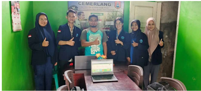
Gambar 6. Evaluasi kegiatan

adanya kegiatan ini, karena sebelum adanya kegiatan pengabdian masyarakat ini, perangkat BUMDes Cemerlang melakukan penyusunan laporan keuangan manual yang terbatas dari pengetahuan dan pengalaman dari beberapa pihak perangkat BUMDes tersebut.