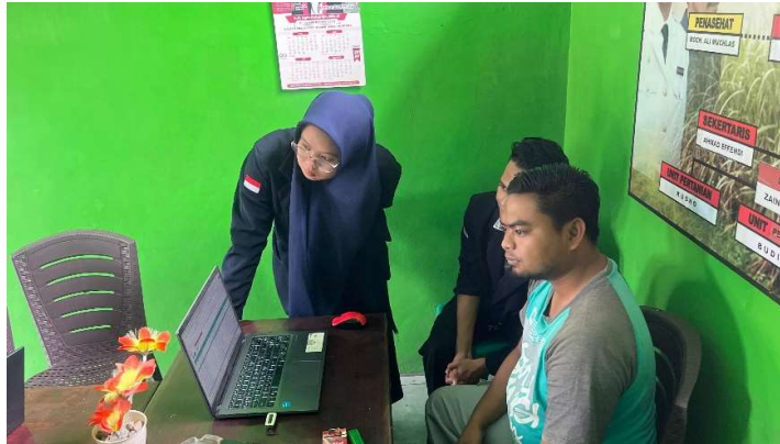
Gambar 5. Penginputan transaksi usaha BUMDes Cemerlang

Ketiga, kegiatan pengenalan aplikasi terhadap BUMDes Cemerlang. Pada tahap ini, tim mahasiswa/i mengadakan sosialisasi terkait bagaimana cara penggunaan aplikasi dagang berbasis excel agar proses penyusunan laporan keuangan dapat dilakukan secara efektif dan efisien serta minim kesalahan dalam proses penyusunannya.