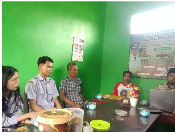
Gambar 1. Survey lokasi kantor BUMDes Cemerlang

Pendamping desa beserta tim mahasiswa/i melakukan survey lokasi atau kondisi BUMDes yang akan diobservasi, dalam hal ini yaitu BUMdes Cemerlang yang terletak di Desa Plerean, Kecamatan Sumber Jambe. Kegiatan ini dilakukan guna mengetahui lebih jelas kondisi di lapangan sebelum pelaksanaan kegiatan inti. Selain itu, tim mahasiswa/i juga mengurus perijinan dengan perangkat BUMDes setempat, serta melakukan sosialisasi rencana kegiatan kepada BUMDes Cemerlang.