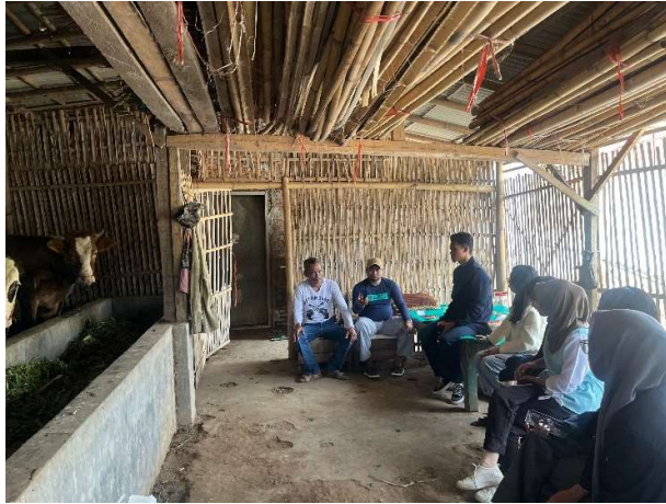
Gambar 2. Survey lokasi usaha BUMDes Cemerlang