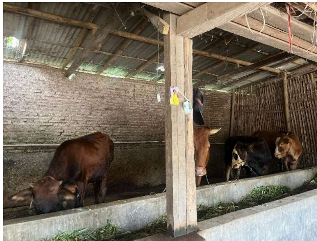
Gambar 3. Objek dalam usaha BUMDes Cemerlang