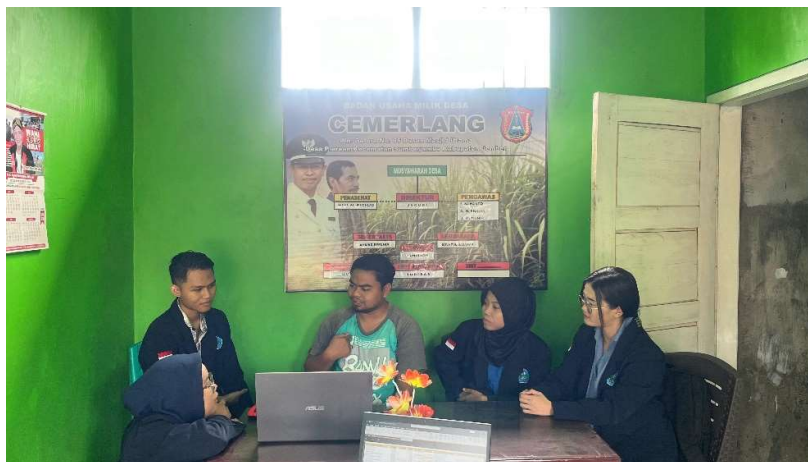
Gambar 6. Pelatihan penggunaan aplikasi berbasis excel

Keempat, kegiatan pelatihan penggunaan aplikasi berbasis excel. Di tahap ini, tim mahasiswa/i melakukan pelatihan pengaplikasian langsung kepada perangkat BUMDes Cemerlang, mulai dari proses identifikasi bukti transaksi, sampai penginputan transaksi ke aplikasi excel.