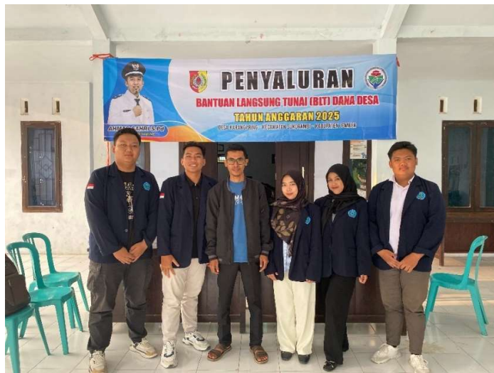
Gambar 2. Proses pendampingan ke BUMDes Tri Jaya Guna Mandiri