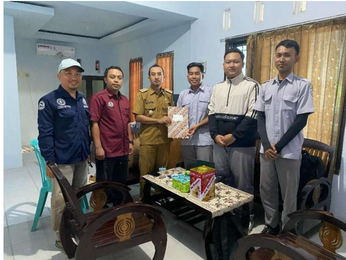
Gambar 1. Proses kunjungan ke Kantor Desa