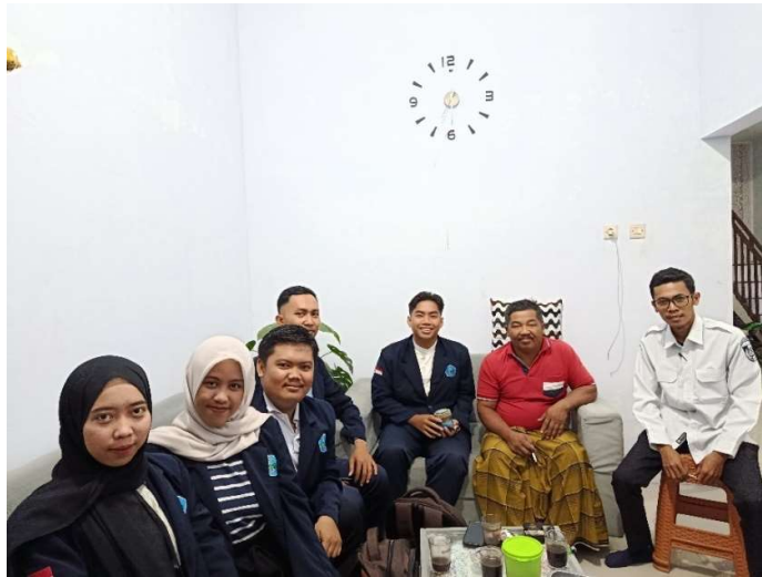
Gambar 3. Proses pendampingan ke BUMDes Tri Jaya Guna Mandiri