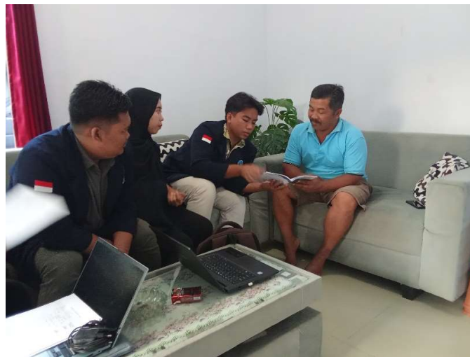
Gambar 4. Proses pendampingan ke BUMDes Tri Jaya Guna Mandiri