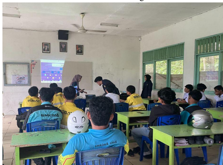
Gambar 4. Dokumentasi Kegiatan Kedua