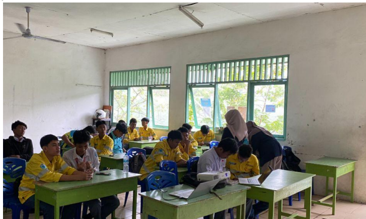
Gambar 3. Dokumentasi Kegiatan Pertama

Tujuan pelaksanaan pendidikan kesehatan untuk meningkatkan pengetahuan remaja terkait dengan good food good sleep good mood dengan mengukur pengetahuan menggunakan pretest dan post test, kegiatan ini diikuti oleh peserta dengan jumlah 27 orang remaja laki-laki tahapan awal dilakukan dengan perkenalan, membagikan leaflet, untuk mendapatkan gambaran pengetahuan terkait good food good sleep good mood selanjutnya diperlihatkan dengan media Power Point selanjutnya dilakukan evaluasi sebagai tahap akhir dengan review ulang, memberikan post test pada remaja di SMK Muhammadiyah 04 Samarinda