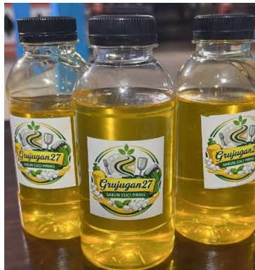
Gambar 3. Hasil pembuatan sabun cuci piring