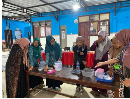
Gambar 2. Praktik Pembuatan sabun cuci piring