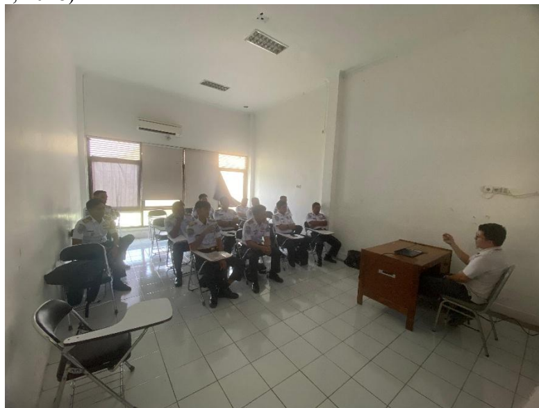
Gambar 3. Pembelajaran Terkait Etika Komunikasi Digital

Tahapan pelaksanaan disusun sistematis agar peserta tidak hanya “tahu”, tetapi benar-benar “mampu”: persiapan (pengumpulan data latihan, persiapan aplikasi, dan pengenalan), sosialisasi (dua kelas untuk literasi data, verifikasi informasi, dan etika komunikasi digital), demonstrasi & praktik (akses web dan instalasi aplikasi Android di smartphone), pendampingan (bimbingan teknis intensif hingga peserta mampu mengambil keputusan berbasis data dan fakta lapangan), lalu penutup (diskusi reflektif, tanya jawab, dan umpan balik). Model tahapan seperti ini konsisten dengan praktik PkM berbasis pelatihan perangkat lunak yang menekankan edukasi, demonstrasi, praktik, dan pendampingan agar kompetensi peserta meningkat dan dapat diaplikasikan (Elfira Wirza et al., 2025). Penggunaan pendekatan praktik juga sejalan dengan kajian pembelajaran berbasis simulator yang menilai penerimaan serta kepuasan peserta dan menekankan pentingnya pengalaman langsung untuk membangun kompetensi operasional (Setiyantara et al., 2018).