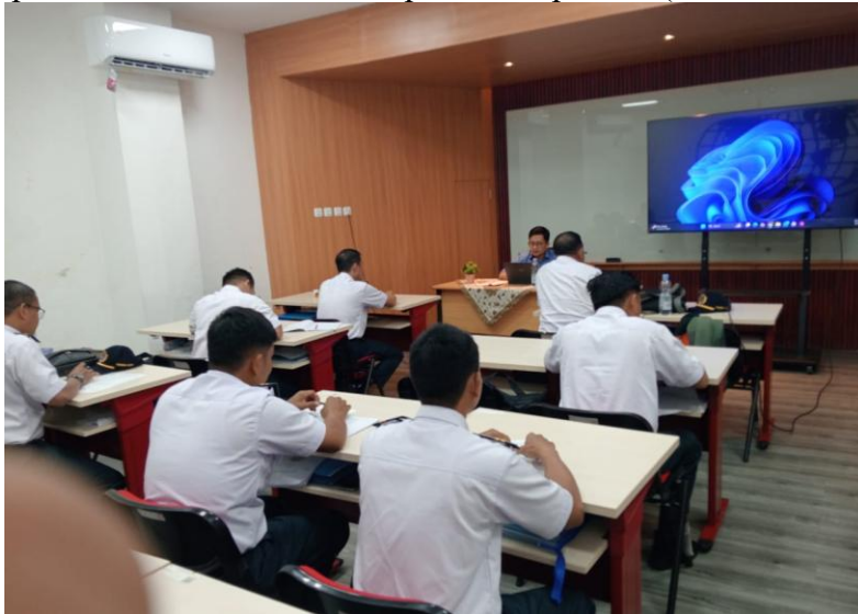
Gambar 1. Proses Pembelajaran di Kelas

dilakukan bertahap—mulai dari pemodelan praktik, latihan, sampai pembiasaan cara kerja yang tertib dan terdokumentasi. Pola pemanfaatan perangkat web/Android sebagai media praktik sejalan dengan pelaksanaan PkM yang mengintegrasikan media berbasis web dan Android dalam pembelajaran maritim serta menekankan pentingnya fasilitas yang mendukung demonstrasi dan praktik langsung (Lestari et al., 2025). Dari sisi tata kelola penyelenggaraan pendidikan vokasi maritim, penataan pelaksanaan yang terstandar dan didukung fasilitas pembelajaran merupakan bagian penting untuk menjaga mutu layanan pelatihan dan konsistensi capaian kompetensi (Utami et al., 2025).