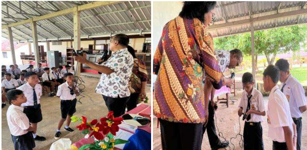
Gambar 3. Praktik penggunaan alat DO Meter

pengukuran langsung tersebut kemudian dicatat, dianalisis, dan dibandingkan dengan standar kualitas lingkungan yang ditentukan.