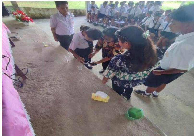
Gambar 4. Praktik penggunaan alat refraktometer

Kegiatan ini diakhiri dengan sesi tanya jawab yang bertujuan untuk memberikan kesempatan bagi para peserta untuk mengajukan pertanyaan seputar pengukuran faktor lingkungan dan aplikasi praktis dari alat-alat yang telah diperkenalkan. Sesi ini memberikan ruang bagi peserta untuk lebih mendalami topik yang mungkin masih belum mereka pahami sepenuhnya, serta untuk menggali cara-cara yang lebih efektif dalam