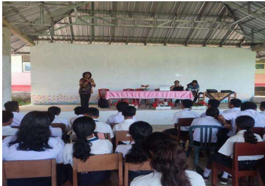
Gambar 2. Penyampaian materi tentang pengenalan alat mengukur faktor lingkungan

Dalam kegiatan ini, materi yang disampaikan berfokus pada pengenalan berbagai peralatan yang digunakan dalam pengukuran faktor lingkungan (Gambar 2). Peralatan ini mencakup alat-alat yang digunakan untuk mengukur parameter lingkungan. Setiap alat memiliki prinsip kerja dan fungsi yang berbeda. Selain itu, peserta juga diperkenalkan pada berbagai teknik kalibrasi dan perawatan peralatan untuk memastikan bahwa alat yang digunakan tetap dalam kondisi optimal dan memberikan hasil yang tepat.