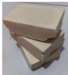
Gambar 4.1 Hasil pembuatan sabun minyak jelantah

Pelaksanaan kegiatan pengabdian ini dilaksanakan tahapan percobaan terlebih dahulu sebelum produk diperkenalkan kepada masyarakat, terlebih dahulu dilakukan pembuatan dan pengujian produk di rumah untuk menjamin kualitas dan keamanan produk sabun dari minyak jelantah, percobaan di rumah dilaksanakan pada tanggal 22-29 Desember 2025. Kegiatan ini bertujuan untuk percobaan pembuatan sabun sehingga didapatkan resep sabun dengan konsentrasi yang pas dan teruji. Takaran bahan yang digunakan dalam percobaan yaitu 250gram minyak jelantah, air destilasi 190gram, 80gram NaOH dan arang secukupnya.