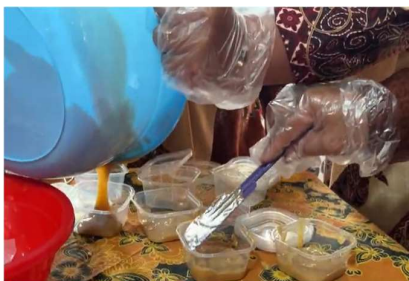
Gambar 4.3. Kegiatan Pembuatan sabun bersama Ibu-ibu PKK