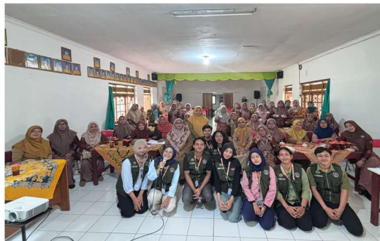
Gambar 4.4 Foto bersama peserta sosialisasi

Berdasarkan praktik dan pendampingan yang dilakukan masyarakat bersama tim KKN dapat dinyatakan bahwa sosialisasi berhasil, karena 90% dari keseluruhan peserta sosialisasi dapat membuat sabun dengan baik dan benar. Hal tersebut dibuktikan dengan data kemampuan pembuatan sabun dari setiap kelompok. Sebagai tindak lanjut dari penyuluhan dan pembinaan mengenai pembuatan sabun ramah lingkungan dari minyak jelantah, maka tim KKN merekomendasikan masyarakat untuk turun ke bidang ekonomi dengan memanfaatkan teknologi terkini.