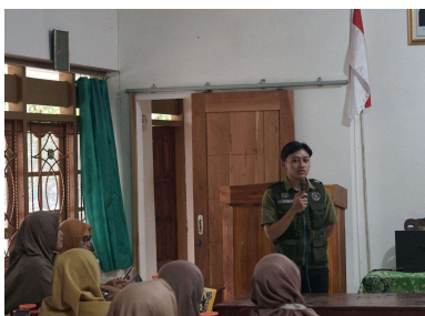
Gambar 4.2. Kegiatan sosialisasi sabun bersama Ibu-ibu PKK

Sosialisasi pembuatan sabun ramah lingkungan dilaksanakan pada Senin, 19 Januari 2026 pukul 13.00 WIB yang bertempat di Aula balai desa Jatiroyo. Pelaksanaan dimulai dengan penyuluhan limbah minyak jelantah bagi lingkungan dengan memberikan informasi mengenai hubungan limbah minyak goreng bekas (jelantah) terhadap lingkungan dan dampak negatif minyak jelantah bagi lingkungan. Respon masyarakat terhadap informasi baru ini sangat baik, hal itu terlihat dari sikap peserta sosialisasi yang menyimak dengan seksama. Kemudian disusul dengan praktik bersama pembuatan secara langsung dalam mengolah minyak jelantah menjadi sabun ramah lingkungan. Kegiatan pengabdian dihadiri oleh 45 orang secara keseluruhan, kemudian dibagi kedalam 5 kelompok. Kelompok tersebut yang kemudian bekerja sama untuk membuat sabun sesuai dengan arahan yang disediakan.