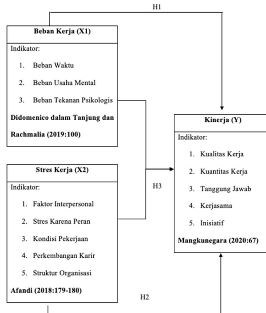
Gambar 1 Kerangka Berpikir