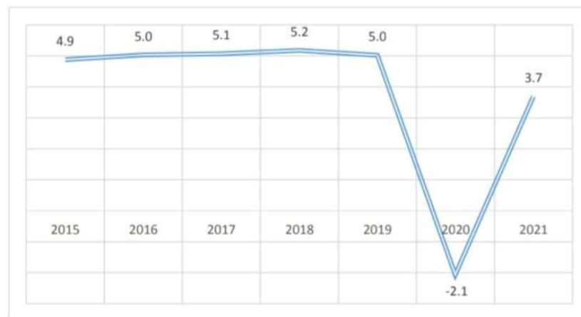
Gambar 1. Pertumbuhan PDB Indonesia 2015-2021 (persen)

Gambar 1 menunjukkan perekonomian Indonesia yang diukur berdasarkan pertumbuhan PDB (Produk Domestik Bruto) selama kurun waktu 2015-2021 yang berfluktuatif. Tahun 2015 ke tahun 2019, pertumbuhan ekonomi cenderung mengalami kenaikan. Ekonomi Indonesia tahun 2020 mengalami kontraksi pertumbuhan sebesar -2,1%. PDB Indonesia turun secara signifikan seiring terjadinya pandemi Covid-19 yang melanda dunia, termasuk Indonesia. Pemerintah Indonesia mengeluarkan berbagai kebijakan guna mengurangi rantai penyebaran pandemi Covid-19, namun kebijakan ini menyebabkan berkurangnya jumlah konsumsi rumah tangga (RT) dan lembaga non profit yang melayani rumah tangga (LNPRRT), sejatinya kedua konsumsi ini sangat memberi pengaruh atas kontraksi pada PDB. Seiring meredanya pandemi Covid-19, pertumbuhan PDB mengalami kenaikan kembali pada tahun 2021 hingga saat ini. Dapat dilihat pada Gambar 1 tentang pertumbuhan PDB di Indonesia tahun 2015-2021.