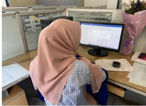
Gambar 1. Dokumentasi Kantor Redaksi Menyusun Berita

Penulis juga melaksanakan layanan editorial dengan membantu Pemimpin Redaksi (EIC) dalam proses penyusunan berita harian. Dalam kegiatan ini, penulis diberikan kepercayaan untuk membuat Today's News Lineup (SHI) dengan menyusun urutan berita yang akan ditayangkan berdasarkan tingkat kepentingan dan kategori berita hangat. Selain itu, penulis juga membantu untuk mengecek berita yang masuk ke Gmail, serta menemukan berita yang dapat diandalkan ketika jumlah berita yang akan ditampilkan masih lebih sedikit. Melalui kegiatan ini, penulis mendapatkan pemahaman tentang proses kerja editorial dan pentingnya akurasi, tanggung jawab, dan koordinasi dalam penyusunan program berita.