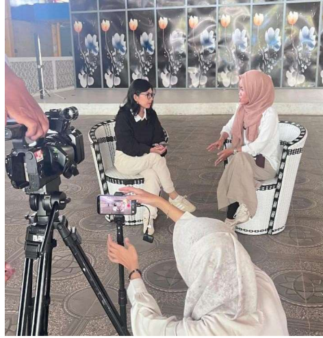
Gambar 3. Dokumentasi Menjadi Narsum

Penulis juga diberikan kesempatan untuk mengisi segmen program Generasi Muda dan menjadi narasumber dalam program tersebut. Topik yang dibahas dalam segmen ini adalah "Aktivis Muda Membawa Perubahan". Kesempatan diberikan kepada penulis karena Divisi Berita tertarik dengan masyarakat yang diikuti penulis yaitu Relawan Muda Peduli Nusantara (RMPN) yang bergerak di bidang kegiatan Sosial & Kemanusiaan, Keagamaan, dan Pendidikan. Pada segmen ini, penulis membagikan pengalamannya tentang kegiatan relawan tersebut, peran generasi muda dalam membawa perubahan positif, dan pentingnya kepedulian sosial terhadap lingkungan sekitar.