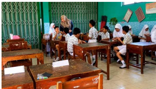
Gambar 2. Pelaksanaan Kuis Situasi Santun

Kegiatan selanjutnya adalah Pos Tantangan Santun. Pada sesi ini setiap kelompok diberikan berbagai tantangan yang berkaitan dengan perilaku santun dalam kehidupan sehari-hari. Tantangan yang diberikan meliputi salam dan sapa, penggunaan bahasa santun, menghormati guru, serta menghargai teman. Siswa diminta mendiskusikan respons yang paling tepat terhadap situasi yang diberikan kemudian menyampaikan hasil diskusi kelompok kepada fasilitator.