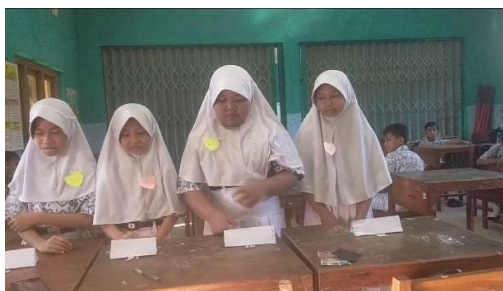
Gambar 3. Pelaksanaan Pos Tantangan Santun

Pelaksanaan kegiatan menunjukkan bahwa pendekatan Experiential Learning mampu memberikan pengalaman belajar yang lebih bermakna bagi siswa. Melalui kuis dan tantangan kelompok, siswa tidak hanya menerima informasi mengenai perilaku santun, tetapi juga memperoleh kesempatan untuk menganalisis situasi, mendiskusikan solusi, serta menentukan respons yang sesuai. Proses tersebut mencerminkan tahapan concrete experience dan reflective observation dalam Experiential Learning , di mana siswa belajar dari pengalaman yang diberikan kemudian merefleksikan perilaku yang tepat dalam situasi tersebut. Pembelajaran menjadi lebih bermakna karena siswa terlibat secara langsung dalam proses belajar, bukan hanya menerima informasi secara pasif.