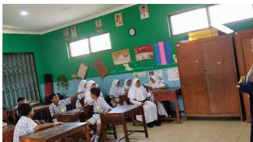
Gambar 1. Pembukaan kegiatan dan pembagian kelompok peserta

Kegiatan inti pertama berupa Kuis Situasi Santun. Pada sesi ini fasilitator memberikan berbagai pertanyaan dan situasi sederhana yang dekat dengan kehidupan sehari-hari siswa. Situasi yang diberikan antara lain mengenai cara bersikap ketika bertemu guru di lingkungan sekolah, cara merespons ketika teman melakukan kesalahan, cara meminjam barang milik teman, serta penggunaan ungkapan santun seperti “tolong”, “maaf”, “terima kasih”, dan “permisi”. Setiap kelompok diberikan kesempatan untuk berdiskusi sebelum menyampaikan jawaban yang dianggap paling tepat.