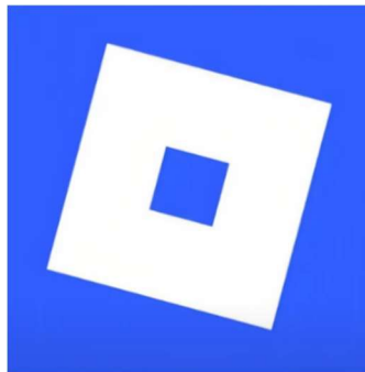
Gambar 1. Logo Roblox

mengubah cara manusia memperoleh informasi, Tapi juga mengubah komunikasi atau interaksi sosial dari yang semula bersifat langsung tatap muka menjadi berbasis media digital atau virtual. Saat ini interaksi sosial tidak hanya terjadi dalam kehidupan nyata, tapi juga berkembang di ruang virtual melalui berbagai platform game online. Salah satu bentuk perkembangan komunikasi digital yang pesat adalah munculnya platform game online Roblox, Roblox merupakan sebuah game online yang diberisi pemain-pemain berkumpul, berkomunikasi, membuat komunitas atau membangun komunitas yang biasa disebut dengan clan. Clan bukan hanya perkumpulan pemain yang bermain bersama, tapi berubah menjadi sebuah identitas digital atau vitrtual yang diakui dan dipertahankan oleh para anggota didalamnya (Pembangunan Jaya, 2026). Biasanya komunitas dalam game online roblox dilihat dengan nama anggota komunitas dan nama pengguna yang digabung, serta mereka mempunyai grup komunitas dalam aplikasi lain yaitu Discord untuk berkomunikasi dengan cara chat, voice dan video call grup.