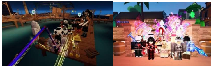
Gambar 2. Contoh Aktivitas Komunitas

memandang dirinya sebagai pemain Roblox secara individu, tapi sebagai bagian dari komunitas Famblox, karena anggota melalui banyak keterlibatan aktif dalam berbagai aktivitas komunitas, seperti bermain bersama di suatu map dalam roblox, biasanya komunitas Famblox sering mengunjungi map yang bisa dimainkan secara berkelompok dan map yang bisa berkumpul untuk mengobrol sambil melakukan aktivitas bermain seperti map together, indohangout, indovoice dan hutan indo.