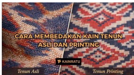
Gambar 1. Tekstur tenun asli dan printing

Melalui pernyataan optimis dari informan di atas tampak jelas sebuah keteguhan sikap dalam menerapkan strategi ekonomi pertahanan budaya dengan memilih jalur diferensiasi murni bukan perang harga. Produsen sadar betul bahwa berkompetisi dengan mesin pabrik raksasa dalam hal kuantitas dan harga adalah langkah yang sia-sia. Oleh karena itu langkah Medali Mas yang konsisten mempertahankan proses Alat Tenun Bukan Mesin dan menonjolkan narasi handmade adalah pilihan ekonomi yang sangat rasional sekaligus ideologis. Kekuatan promosi mereka justru bertumpu pada transparansi proses produksi dengan menjelaskan kepada konsumen tentang kerumitan menyusun motif benang sehelai demi sehelai lamanya waktu pengerjaan dan curahan keringat para pengrajin lokal. Narasi edukasi proses ini berhasil mengubah paradigma konsumen dalam melihat harga sehingga harga mahal tidak lagi dinilai sebagai pemborosan finansial melainkan dipandang sebagai sebuah bentuk investasi seni prestise dan kebanggaan sosiokultural yang bernilai tinggi.