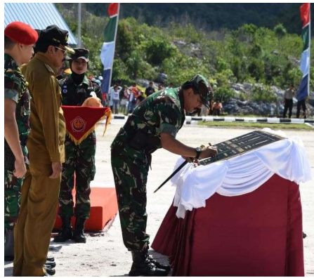
Gambar 2. Peresmian Satuan TNI Terintegrasi Natuna

Dalam sistem internasional yang anarki, Indonesia menerapkan prinsip self-help dengan melakukan transformasi pertahanan di Kepulauan Natuna dari pangkalan administratif menjadi pangkalan militer terpadu. Penguatan ini mencakup peningkatan status Pangkalan TNI Angkatan Laut (Lanal) menjadi Pangkalan Utama TNI Angkatan Laut (Lantamal) serta integrasi kekuatan darat dan udara. Langkah ini diambil karena adanya ketidakpastian keamanan yang permanen di Laut Natuna Utara, di mana kehadiran militer dianggap sebagai satu-satunya instrumen untuk menciptakan efek gentar ( deterrence ) terhadap kapal-kapal asing yang mencoba melanggar batas wilayah.