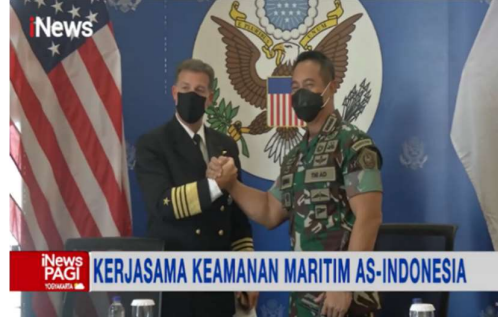
Gambar 3. Kerjasama Keamanan Maritim AS-Indonesia

Sebagai bagian dari strategi penguatan keamanan di Laut Natuna Utara, Indonesia secara aktif menjalin kerja sama pertahanan dengan Amerika Serikat guna meningkatkan kapasitas operasional dan intelijen maritim. Kerja sama ini diwujudkan melalui berbagai latihan militer bersama, bantuan teknis alutsista, serta pembangunan pusat pelatihan maritim. Bagi Indonesia, AS dipandang sebagai mitra strategis yang memiliki kapabilitas teknologi dan militer yang mampu mengimbangi dominasi Cina di kawasan, sekaligus memberikan jaminan keamanan terhadap stabilitas jalur pelayaran internasional di Laut Natuna Utara (Tertia & Perwita, 2018).