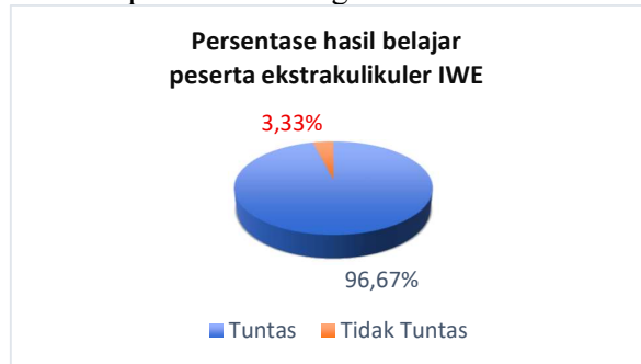
Diagram 4.3 Hasil Belajar Ekstrakurikuler

Berdasarkan perhitungan diatas dengan rerata 96,67% jika dikonsultasikan dengan tabel 3.4 maka perhitungan tersebut termasuk dalam kategori "Sangat baik" dari perhitungan tersebut di buatlah persentase sebagai berikut: