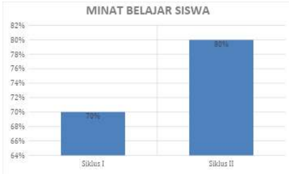
Grafik 2. Perbandingan Minat Speaking skill peserta didik

Dari grafik 1 dan 2 dapat dilihat bahwa dengan adanya program English club dapat meningkatkan minat kemampuan speaking skill bagi peserta didik baik dianalisis dari hasil persentase per indicator maupun rata-rata secara keseluruhan.