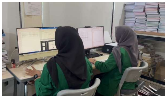
Gambar 1. Penginputan pada Repository