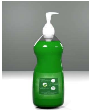
Gambar 4 Prototipe Desain Kemasan

Dalam artikel ini, HoQ tahap pertama dan tahap keempat disajikan secara lebih rinci karena mewakili proses awal dan hasil akhir dari penerapan metode QFD. Sementara itu, HoQ tahap kedua dan ketiga dijelaskan secara singkat untuk menggambarkan alur analisis tanpa mengurangi substansi penelitian.