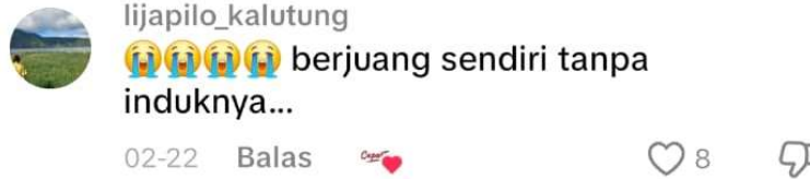
Gambar 2. Komentar pada unggahan TikTok @ Inilah.com pada tanggal 22 februari 2026

monyet(punch) tersebut membaik, sehingga pembaca ikut merasakan emosi yang dibangun oleh penutur melalui informasi dan ekspresi yang disampaikan.