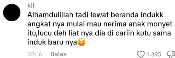
Gambar 1. Komentar pada unggahan TikTok @Inilah.com pada tanggal 16 februari 2026

Berikut hasil analisis 3 komentar netizen di tiktok pada fenomena bayi Punch dan ditemukan ketiganya masuk dalam tiga unsur tindak tutur lokusi, ilokusi dan perlokusi.