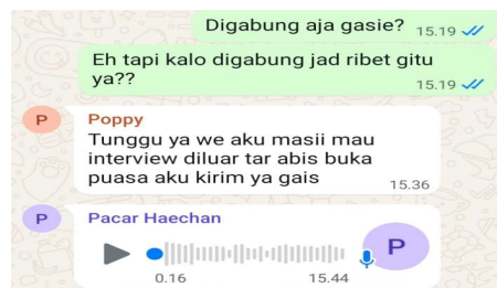
Gambar 3. Chat WhatsApp pada Tanggal 22 Februari 2026

Tuturan yang dianalisis dalam penelitian ini adalah: “Tunggu ya, aku masih mau interview di luar, nanti habis buka puasa aku kirim ya gais.”