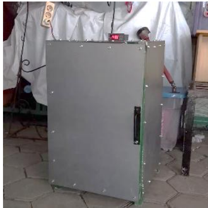
Gambar 2. Desain Alat Pengering Sepatu

Perancangan mesin pengering sepatu ini mengutamakan efisiensi termal dan kontrol presisi. Secara mekanis, rangka alat didesain terisolasi menggunakan material yang menjaga panas didalam ruang chamber agar sirkulasi udara optimal. Berikut ini desain alat pengering sepatu yang akan dibuat.