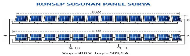
Gambar 5. Susunan Panel Surya