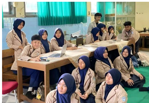
Gambar 2 Sesi praktik peserta dalam menyusun surat resmi