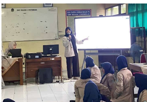
Gambar 5 Antusiasme peserta selama mengikuti sosialisasi & pelatihan