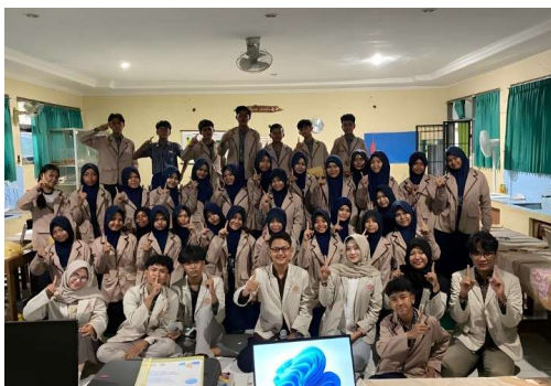
Gambar 1 Foto bersama dengan seluruh anggota