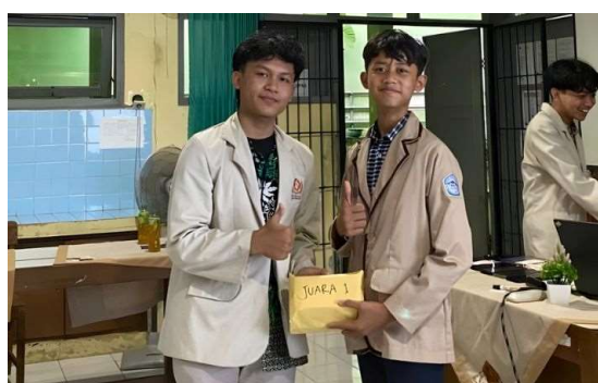
Gambar 6 Dokumentasi penyerahan apresiasi kepada peserta kegiatan