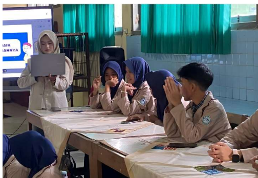
Gambar 3 Pendampingan peserta saat praktik pembuatan surat resmi